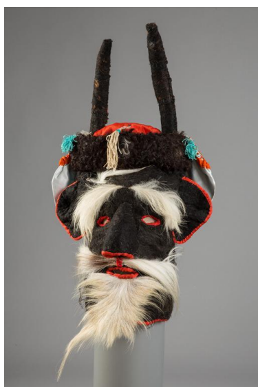
Маска свадебная “Козёл”. Кабардинцы. Вторая половина XXв.