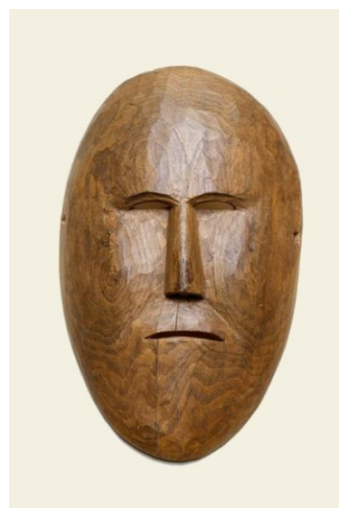
Ритуальная маска. Коряки. Начало XXв.